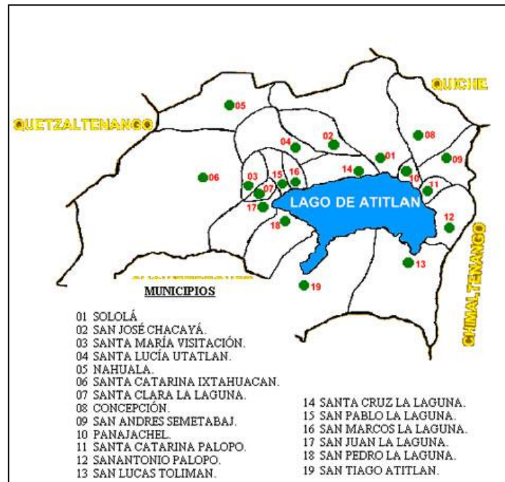
Tabla 3: División político-administrativa del departamento de Sololá.

La población económicamente activa del Municipio es el 23% y el 21,7% son mujeres. El sector productivo más importante es la agricultura, seguido por el comercio y la prestación de servicios.