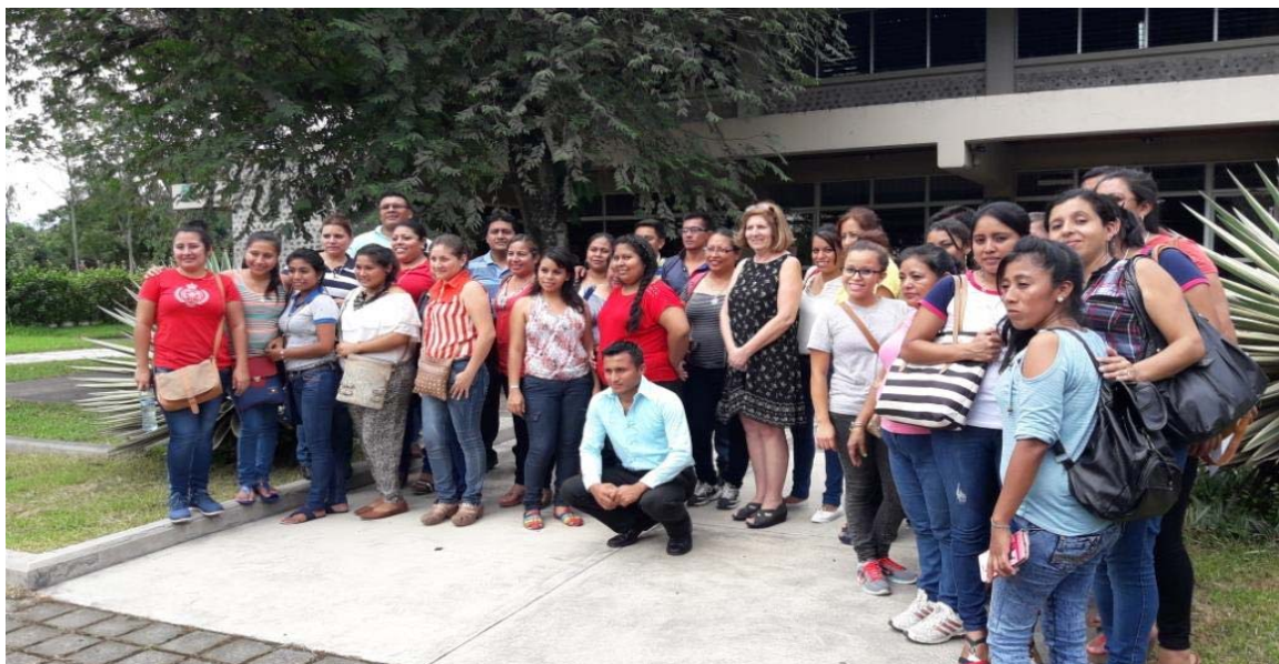
Clausura de diplomado de matemáticas realizado en Suchitepéquez