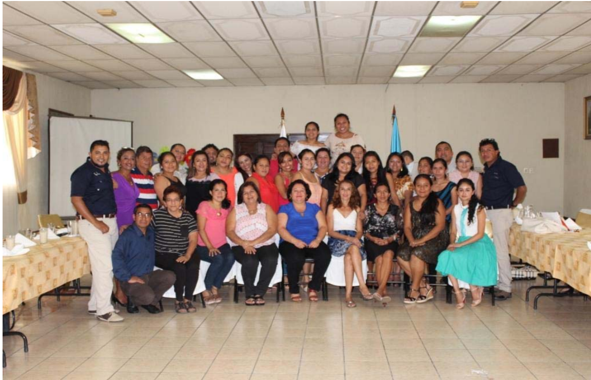
Clausura de diplomado de matemáticas realizado en Retalhuelue